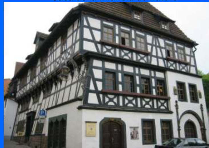
• Casa de la infancia de Lutero

en 1502 y doctoró en 1505. Después, quiso estudiar derecho (como su padre quería) pero, al haber tenido varios encuentros con la muerte, encontró la fugacidad de la vida ingresó en el monasterio agustino de Erfurt (decisión sorprendente para sus familiares). En 1506 estuvo como monje y en 1507 le ordenaron sacerdote.